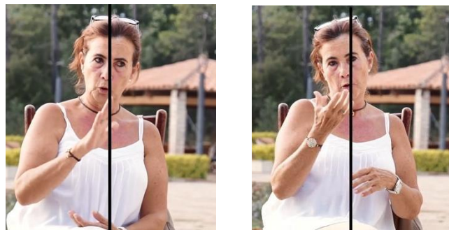
Figura 2. Ejemplo de movimiento de cabeza en la concesión.

Del mismo modo, en la figura 3, la signante S1 expresa otra concesión. Como se muestra en la primera imagen, que corresponde a la concesión, inclina ligeramente el torso junto con la cabeza hacia su derecha y, cuando verbaliza la crítica, hacia su izquierda y ligeramente hacia atrás, como aparece en la segunda imagen.