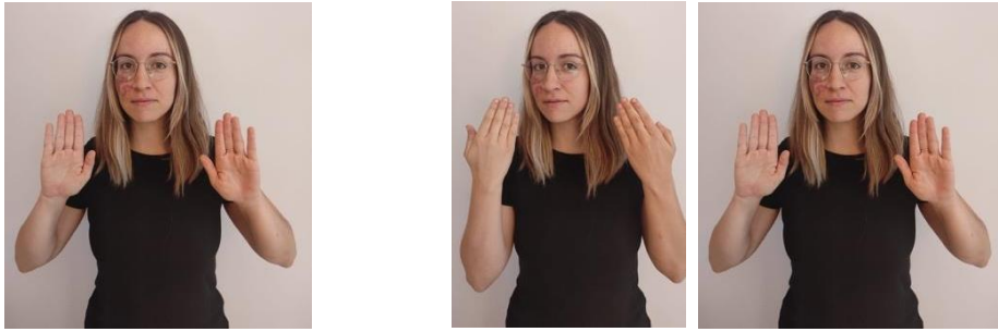
Figura 1. Signos PERO y AUNQUE respectivamente.