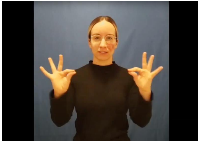
Resumen en lengua de signos catalana

Este trabajo se centra en estudiar la cortesía en lengua de signos catalana (LSC). Concretamente, nos interesa la expresión de la atenuación lingüística en las críticas. La motivación principal que impulsa esta investigación parte de la concepción de la universalidad de la cortesía, que indica que este fenómeno está presente en todas las culturas del mundo, pero cuya expresión varía en función de cada cultura específica. Esta variación se encuentra también en la comunidad Sorda, ya que cuenta con su propia identidad y cultura. El objetivo es analizar la atenuación concretamente mediante la estrategia discursiva de la concesión —una valoración positiva que se usa para contrastar otra negativa— y, al mismo tiempo, estudiar los marcadores no manuales (MNM) involucrados. Los datos proceden de un concurso televisivo y se trata de discursos reales y espontáneos en LSC por parte de personas Sordas adultas. Los resultados nos indican que, aunque la estructura de la concesión no parece favorecer la atenuación, en muchas ocasiones se omite el nexos adversativo de oposición. Además, los MNM de contraste que deberían aparecer a priori en las concesiones en LSC, bien no aparecen, o bien se reducen a su mínima expresión. Esto resulta en una atenuación