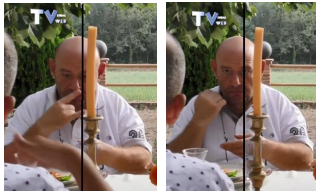
Figura 4. Ejemplo de movimiento de torso en la concesión.

Algo parecido sucede en la figura 4 que mostramos a continuación. El signante S4 se inclina muy ligeramente hacia su derecha para la concesión y, posteriormente, hacia la izquierda para la crítica. Como se puede observar, el desplazamiento es mínimo y, en este caso, únicamente aparece el desplazamiento del tronco sin el de la cabeza.