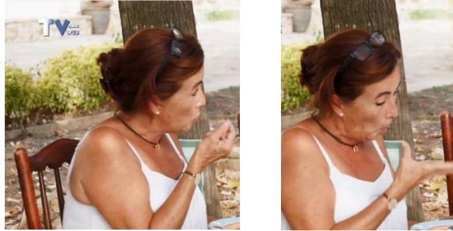
Figura 5. Ejemplo de afirmación con la cabeza en la concesión, sobre el signo BUENO.

afirmaciones. Solo en los 2 casos restantes sin este MNM —representan el 16,7%— encontramos una sonrisa sobre la concesión en un caso, y en el otro no hay ninguna marca lingüística. A modo ilustrativo, en la figura 5 vemos un ejemplo de este movimiento de cabeza hacia adelante en forma de afirmación en una concesión, concretamente sobre el adjetivo BUENO. En ningún caso hemos encontrado este énfasis prosódico sobre las críticas.