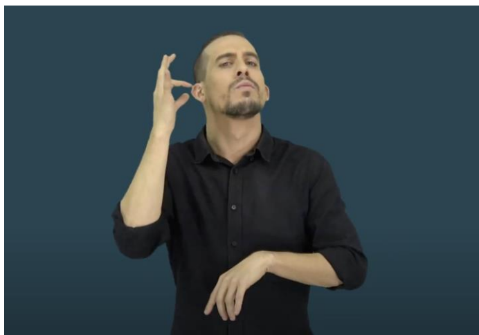
Resumen en lengua de signos española

La existencia de los servicios de accesibilidad audiovisual en medios tan populares como la televisión, así como su regulación, su calidad y su implementación, han sido uno de los temas por excelencia dentro de la literatura académica relacionada con los estudios de la discapacidad o disability studies . Este estudio pretende profundizar e ir más allá del propio servicio de accesibilidad para ahondar en las características propias de los intérpretes de lengua de signos, en concreto, a razón de su género. ¿Qué género tiene más representación en la televisión? A esta pregunta de investigación, se ha hecho un análisis cuantitativo y comparativo del número de horas de televisión signada por hombres y por mujeres en todos los canales de la TDT española durante el mes de noviembre del año 2020.