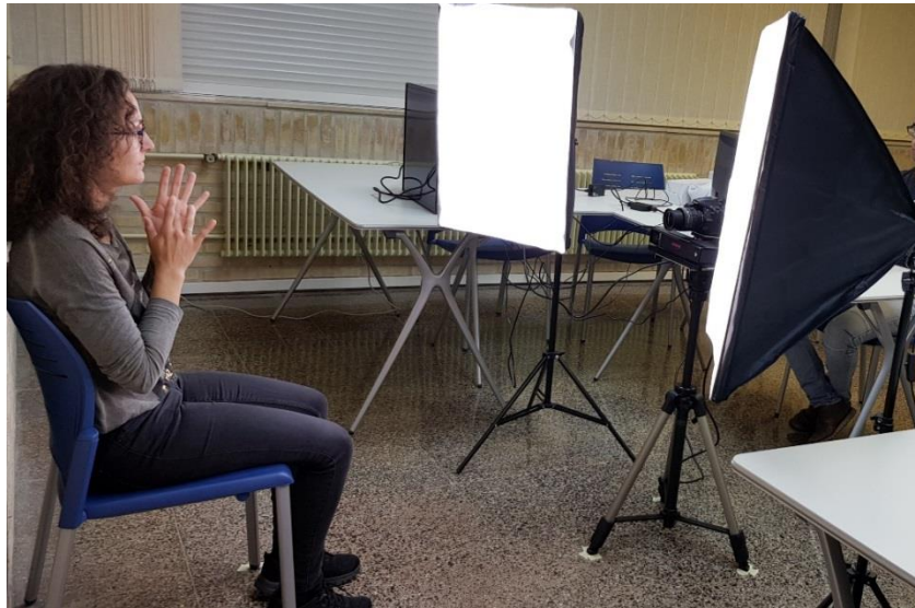
Figura 2: puesto de grabación desplegado en un aula de la Universidad de Vigo.

Torres, S., García, C., Cabeza, C. y Docío, L. (2020). “LSE_Lex40_UVIGO: Una base de datos específicamente diseñada para el desarrollo de tecnología de reconocimiento automático de LSE”. Revista de Estudios de Lenguas de Signos REVLES , 2: 156-177.