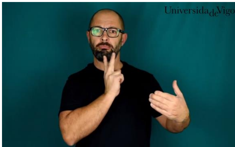
Resumen en lengua de signos española.

El reconocimiento automático de habla puede considerarse una tecnología viable y madura, sobre la que se basan numerosas aplicaciones que facilitan la comunicación entre personas, y entre persona y máquina. Sin embargo, el reconocimiento automático de lenguas de signos no está tan avanzado como el de lenguas habladas; si lo estuviera, una persona sorda podría comunicarse con alguien que desconozca la lengua de signos sin necesidad de recurrir a un intérprete, ganando en privacidad e independencia. Y